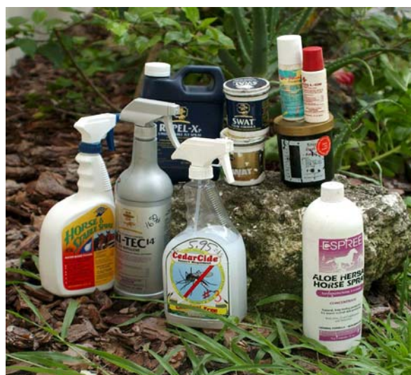
Figura 3. Existe gran variedad de insecticidas y repelentes locales.

La protección contra mosquitos mejor conocida y más frecuentemente usada es el rociador contra moscas. Existen muchos tipos diferentes que contienen gran variedad de ingredientes (Figura 3).